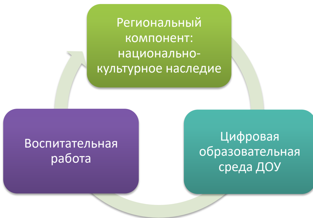
Рис.1. Целевые проекты программы развития